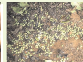
queda dos frutos