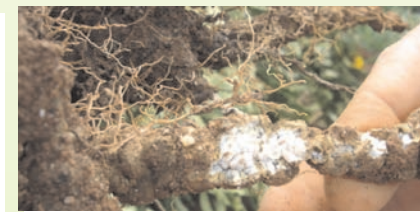
críptas (ou pipocas) nas raízes