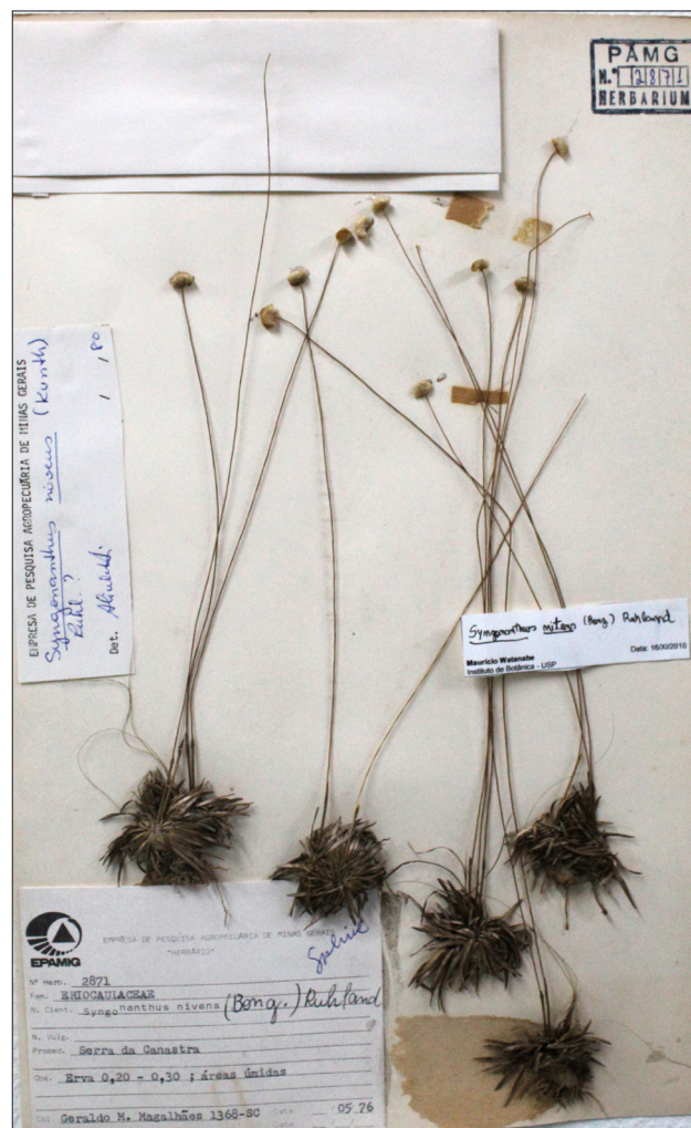
Figura 1 - Espécime de Syngonanthus nitens (capim-dourado) amostrada na EPAMIG - Herbário PAMG, Belo Horizonte, MG

As plantas da família Eriocaulaceae são ervas perenes, com folhas reunidas em rosetas basais, na maioria das espécies, de onde emergem os escapos florais (estruturas que carregam as flores) protegidos por espátas cilíndricas (folhas protetoras). As inflorescências podem ser terminais (no ápice das plantas) ou axilares (nas folhas), capituliformes, globo-