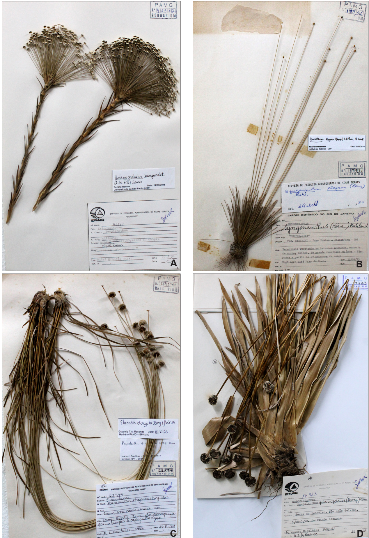
Nota: A - Actinocephalus bongardii ; B - Comanthera elegans ; C - Floralia elongata ; D - Paepalanthus planifolius .