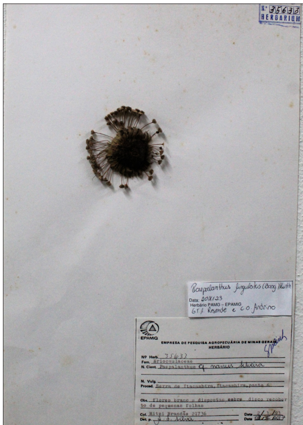
Figura 4 - Exsicata de Paepalanthus lingulatus catalogada na EPAMIG - Herbário PAMG, Belo Horizonte, MG