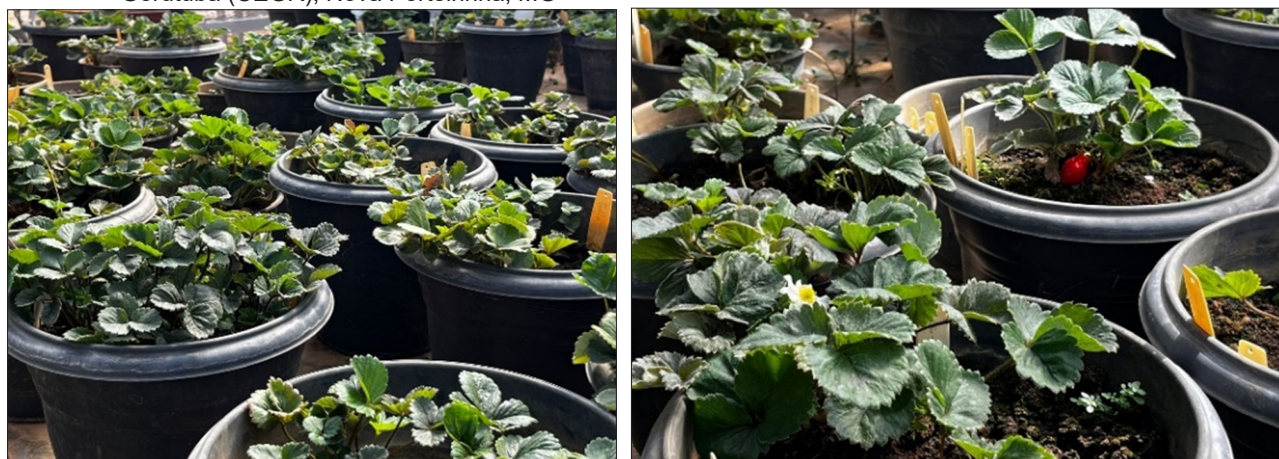
Figura 1 - Híbridos pertencentes ao Banco de Germoplasma do Morangueiro da EPAMIG Norte - Campo Experimental do Gorutuba (CEGR), Nova Porteirinha, MG

Os produtos da amplificação foram separados por eletroforese, em gel de agarose 2%, em tampão